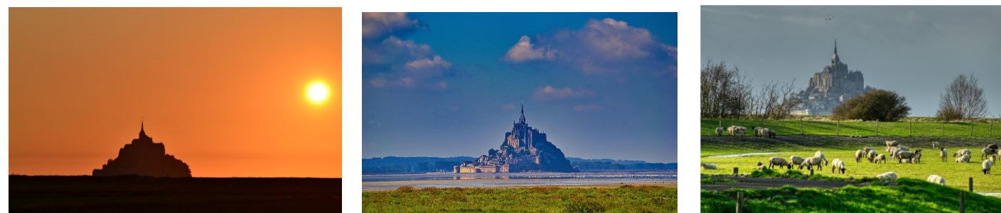
「モン・サン・ミッシェル」に行くのはこれが最期でも大丈夫です、3連泊のホテルから目の前が世界遺産です

Hotel le Relais du Roy (モン・サン・ミッシェル)、Les Cascades (オンフルール) その他同等クラス